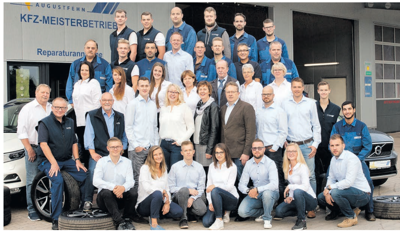
Das Team der Auto Gnieser GmbH in Augustfehn freut sich auf Besucher zum 25-jährigen Jubiläum